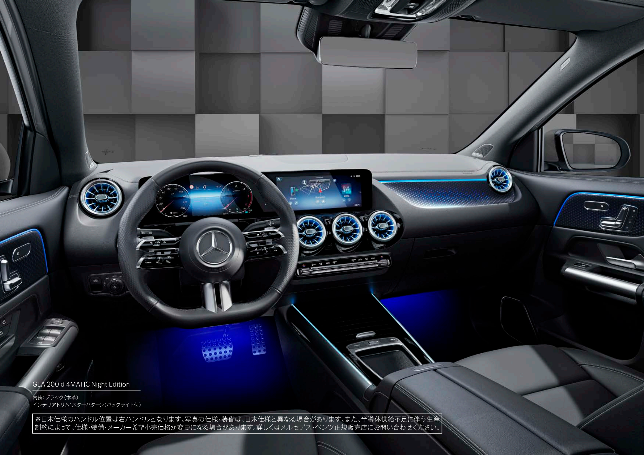
GLA 200 d 4MATIC Night Edition