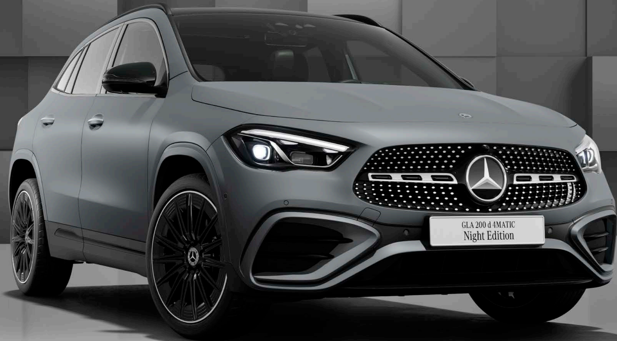
GLA 200 d 4MATIC Night Edition